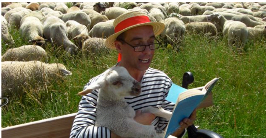
Was die anderen so schreiben ist immer wieder schön zu lesen....