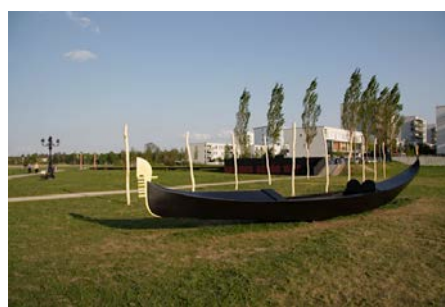
Venedig in München. Kunst am Bau 2008

Die installierten Objekte setzen sich zusammen aus Anlegepfosten, Stahlgondel, 50 Meter Holzsteg, Laterne mit Parkbank, Marmorlöwe, bestehende Mauer mit einem Zitat aus Thomas Manns Novelle „Tod in Venedig“ und einer Performance, bei der Schweitzer einer Schafherde die Kunst erklärt: „Schäferstündchen“.