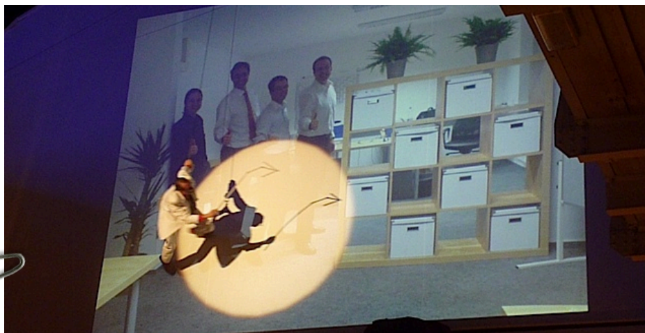
Schweitzer arbeitet immer auf höchstem Niveau.