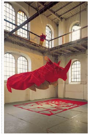
Ein Nashorn aus Teppichboden