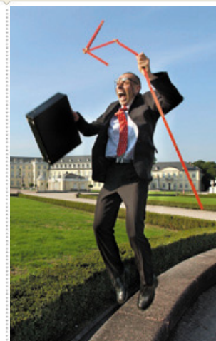
Schweitzer freut sich