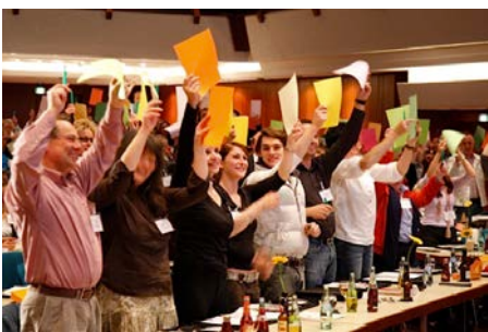
„Das Publikum darf dabei auch mal Farbe bekennen.“

Anhand des Märchens „Die Bremer Stadtmusikanten“ werden die Gäste unvergessliche Eindrücke erhalten. Ein Mix aus Vortrag, Interaktion der Teilnehmer, Improvisation und Schwarmintelligenz.