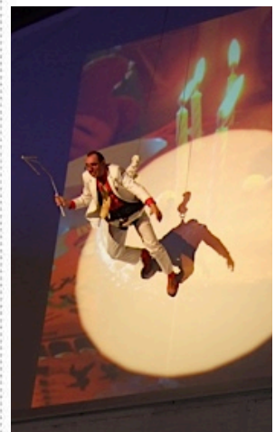
Immer im Fokus.