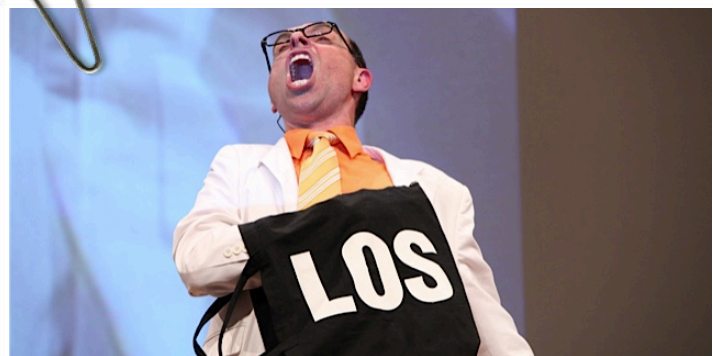
Mit Schweitzer an ihrer Seite ist immer was los.

Michael Gans 19.07.11 www.smiletheband.com