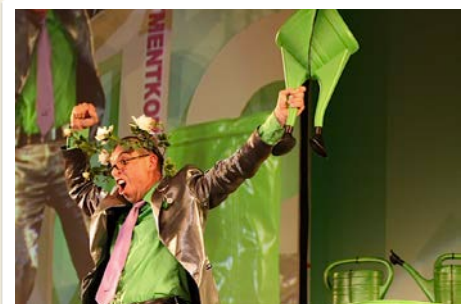
„Volle Kanne Humor!“