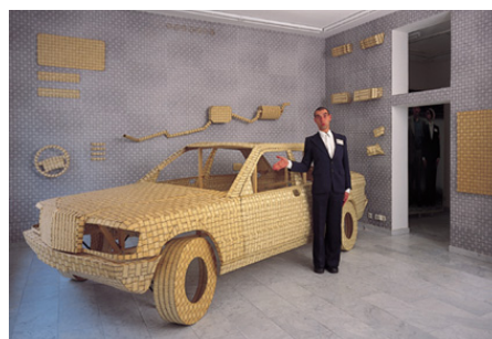
Mercedes Benz aus 500 000 Streichhölzern

AlittleMORElove ist programmatisch zu verstehen: durch die Romantik, die das venezianische Klischee mit sich bringt, entwickelten die Anwohner bereits sehr bald eine positive Identifikation mit ihrem Quartier. Davon zeugen bereits mehrere „Markusfeste“ der Bewohner, bei denen Schweitzer performte. ( www.quivid.de )