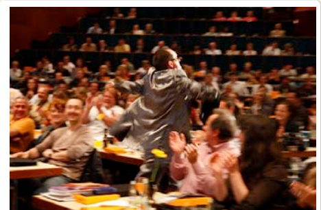
Die Menschen sind seine Bühne.

Kurz: Schweitzer steuert beschwingten Schrittes durch jedes Happening und schafft eine Atmosphäre, in der sich alle wohlfühlen.