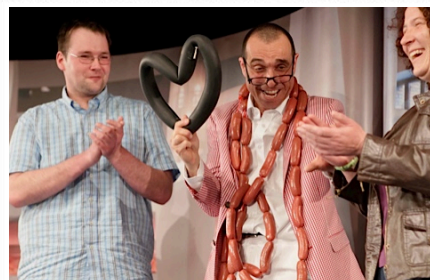
Es geht nicht immer um die Wurst. Aber immer um die...