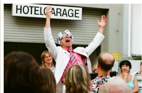
„Keine Türe bleibt mit mir verschlossen!“